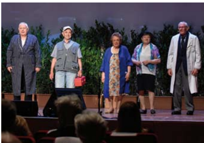
I nostri attori

Comandante Generale dell'Arma dei Carabinieri Tullio Del Sette "per aver arricchito la storia gloriosa dell'Arma dei Carabinieri, estendendone la missione al grande tema della solidarietà umana, con un costante impegno nelle operazioni a favore delle popolazioni delle zone terremotate del Centro Italia" e al Sindaco di Amatrice Sergio Pirozzi, "in considerazione dell'impegno profuso a sostegno della popolazione di Amatrice colpita dal tragico sisma".