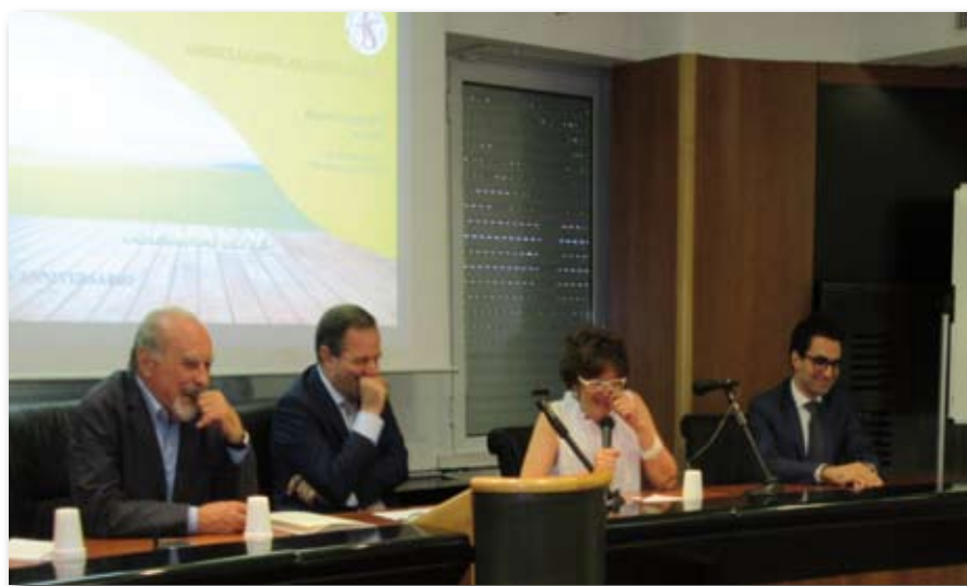
Il nuovo consiglio di amministrazione

Nel Novembre 2003, nel presentare il primo numero di Sotto il Sole di Roma dicevamo: