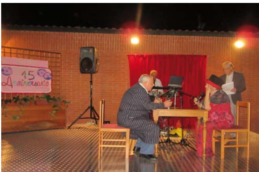
Un brano della commedia "Innamorarsi a settant'anni"