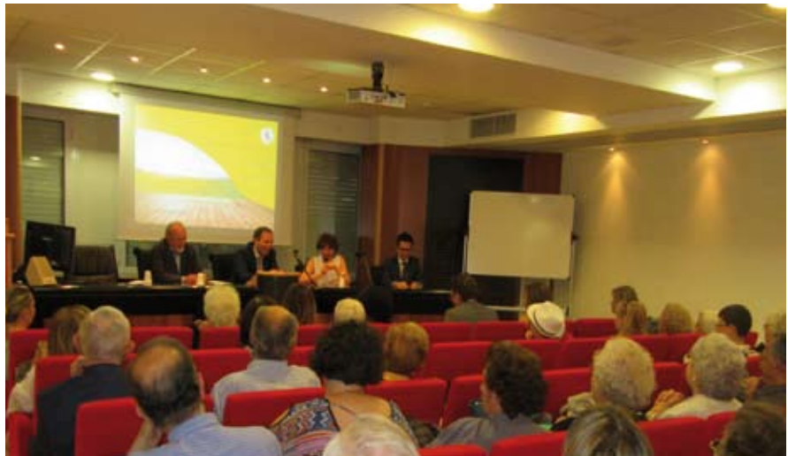
In aula magna