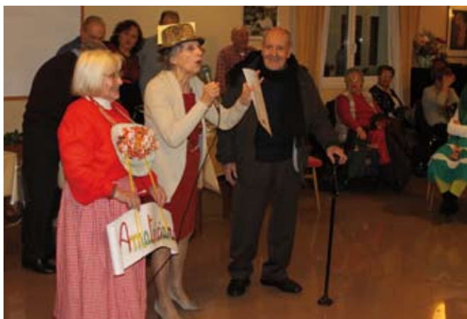
Il primo premio

"Nella Liguria ha avuto i sui natali/ è un grande spadaccino/ vanitoso/ vestito di colore molto acceso/ dominator dell'universo è inteso/ Amico del "gran diavolo" d'inferno/ parente della spada e della mortel/ con lui la gente deve stare attenta/ buoni ragazzi! è capitan Spaventa – Si nutre senza fare grosse spese/ basilico col pesto genovese"